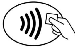
Symbol auf Lesegeräten (Grafik: Joachim Lomoth)